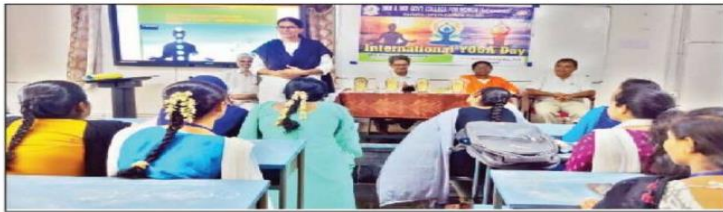
కళాశాలలో యోగా దినోత్సవ కార్యక్రమంలో పాల్గొన్న విద్యార్థినులు

22/06/2024 | Kadapa | Page : 3